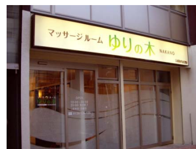
「マッサージルームゆりの木」外観

※50分間のマッサージの半額券を、読者の方へプレゼントとしてご提供することも可能です。お気軽にお問合せ下さい。